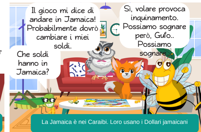
L'aereo non è un mezzo di trasporto sostenibile. Scopri cosa significa "sostenibilità".